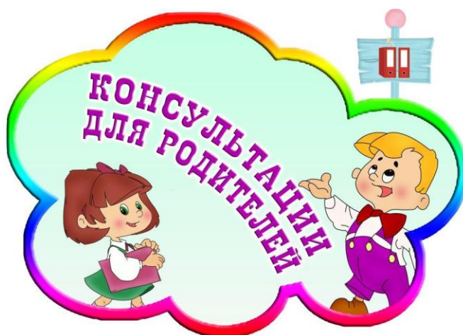
График индивидуальных консультаций специалистов консультационного центра: